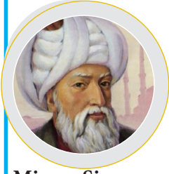
Mimar Sinan (1490-1588)

*Mimar Sinan, Osmanlı padişahlarından I. Süleyman, II. Selim ve III. Murat dönemlerinde başmimar olarak görev yapmıştır. Birçok esere imza atan Mimar Sinan, üç eseriyle herkes tarafından tanınmıştır.